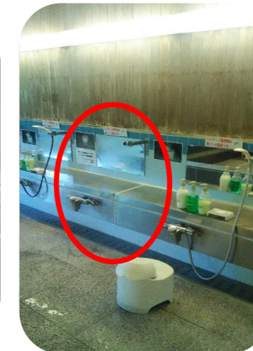
フロント順番待ちに於ける距離確保 テーブルを大きくし座席間隔を広く確保 1個おきにシャワーヘッド、ホース撤去